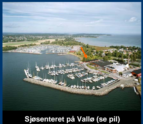
Sjøsenderet på Vallø (se pil)