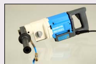
TSH 163 Håndholdt